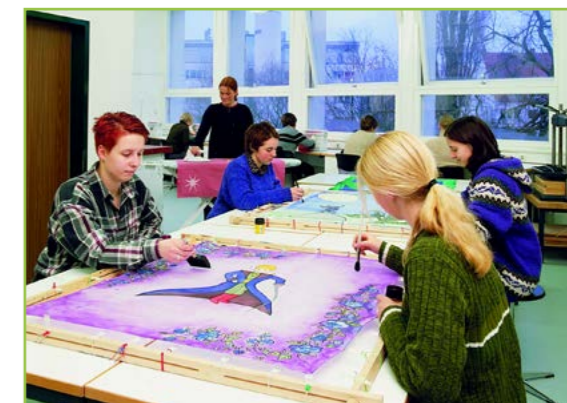
Bis heute ein Schwerpunkt: Praxisbezogener Unterricht in den Gesundheits- und Wirtschaftsschulen.