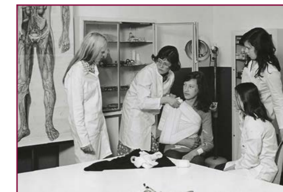
Praxis-Unterricht in der Arzthelferinnen-Schule.