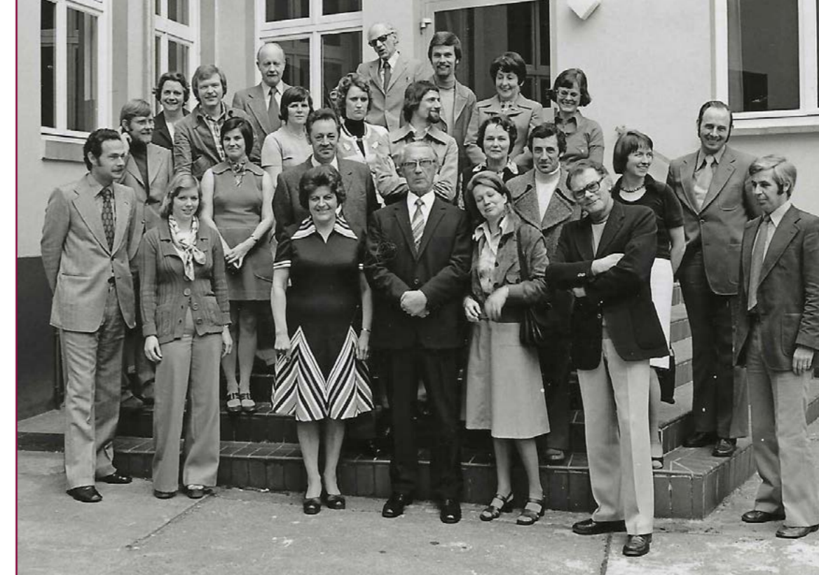
Das Kollegium 1975.