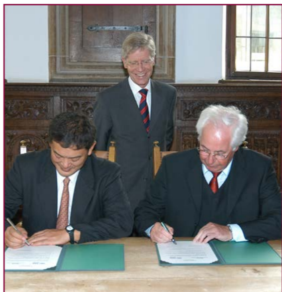
Feierliche Besiegelung der Partnerschaft mit dem Kanazawa Century College.