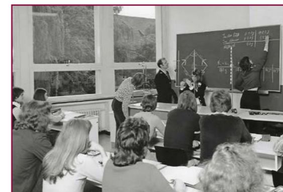
Unterricht in der Wirtschaftsschule.